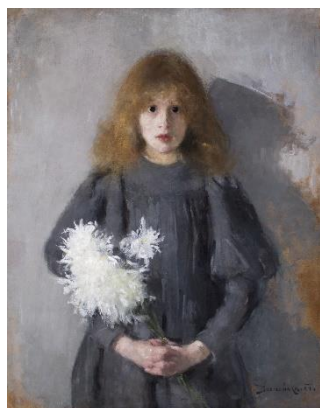
オルガ・ボズナンスカ 《菊を抱く少女》1894年 クラクフ国立博物館蔵