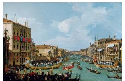
カナレット《カナル・グランデのレガッタ》 1730-1739年頃 ボウズ美術館、ダラム The Bowes Museum, Barnard Castle, Co. Durham, England