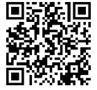
トイカード QR コード

こども商品券は、おもちゃ、ベビー・子供用品、文具等にご利用いただける、こどものための商品券です。利用可能店舗はトイザラス、Joshin、エディオン、イオン、アカチャンホンポ、東京靴流通センター、カメラのキタムラ、スタジオマリオ、高島屋、近鉄百貨店、阪急百貨店、阪神百貨店等全国約7,000の加盟店でご利用いただけます。詳しくは、トイカードホームページをご覧ください。 https://toycard.co.jp/