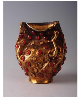
一級文物《瑪瑙象嵌杯》、5-7世紀、 1997年新疆ウイグル自治区イリ州 昭蘇県ボマ古墳出土、イリ州博物館蔵

開催期間 11月23日(土・祝)～2025年2月2日(日) 会場 京都文化博物館(京都市中京区三条高倉) 開館時間 10:00～18:00(金曜日は19:30まで) (入場は閉室30分前まで) 幹旋料金 一般 1,000円(当日料金1,600円) 大高生 500円(当日料金1,000円) 中小生 200円(当日料金500円) 幹旋枚数 40枚(会員一人につき、4枚までとさせていただきます。) 申込期間 11月22日(金)まで受付します。 月曜休館(ただし1/13は開館)、12/28～1/3、1/14) 障がい者手帳等をご提示の方と付き添い1名は無料。