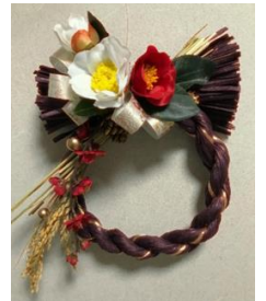
②和モダンしめ縄作品例

*申込締切後のキャンセル及び当日ご欠席の場合も参加費は返金できませんのでご注意ください。