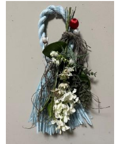
③和モダンしめ縄 スワッグタイプ作品例