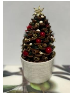
①松ぼっくりツリー作品例 高さは約15cm程度